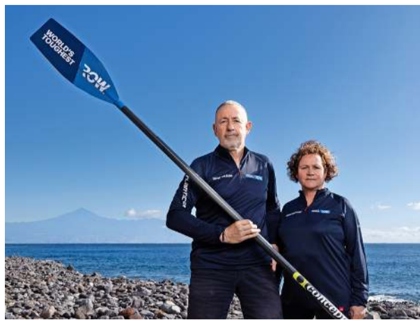
Eine Seefahrt, die ist nicht immer lustig: Selbst die Dämmerung hinter den Bordinstrumenten und dem Rückspiegel kann nicht vom Wellengang ablenken.